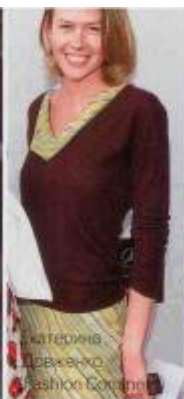
Катерина Давченко Fashion Boutique