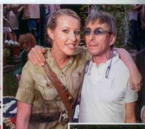
Ксения Собчак и Умар Джабраилов